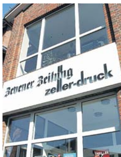
Der Anbau der Geschäftsstelle erfolgte in den 1990er Jahren.

Die gemieteten Betriebsräume bei Hinc an der Langen Straße werden schnell zu eng. Das Unternehmen wechselt kurzzeitig in die alte Posthalterei, doch nach nicht einmal zehn Jahren folgt ein erneuter Umzug, diesmal in das