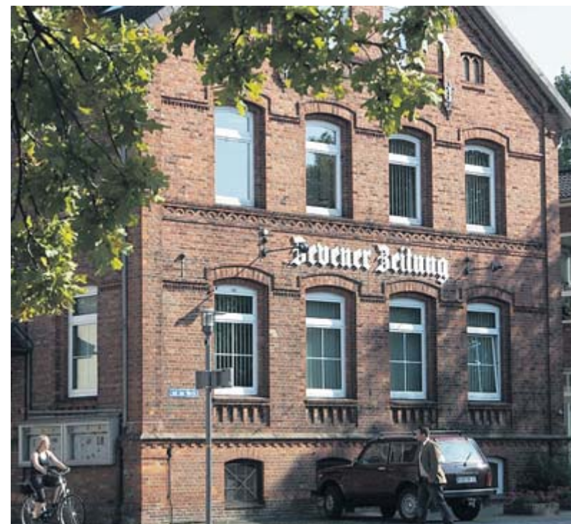
Standorttreu: Seit rund 100 Jahren kommt die Zevenener Zeitung aus dem Haus Gartenstraße 4.